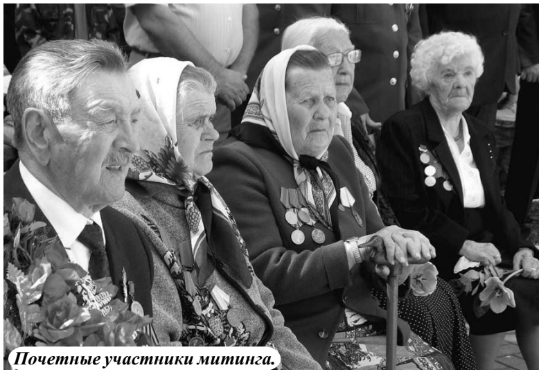
Почетные участники митинга.

День Победы в этом году был всем на радость солнечным и теплым. И бабынинцы поспешили воспользоваться возможностью провести его не только в кругу близких, но и с друзьями, знакомыми, детьми на улицах райцентра. Цветы, шарики, огромные банты, нарядные платья, улыбки, смех – действительно праздничный день.